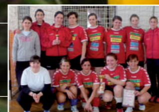
Helyi sport események 15. oldal