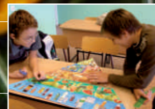
Egészségét az iskolában 7. oldal