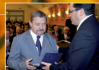
Kitüntetések és kitüntetettek 4. oldal

Kerekegyháza Város Önkormányzat Polgármesteri Hivatal időszakos kiadványa